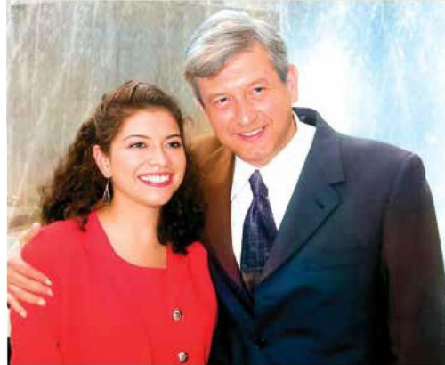
Desde joven, ha participado en el movimiento impulsado por Andrés Manuel López Obrador.