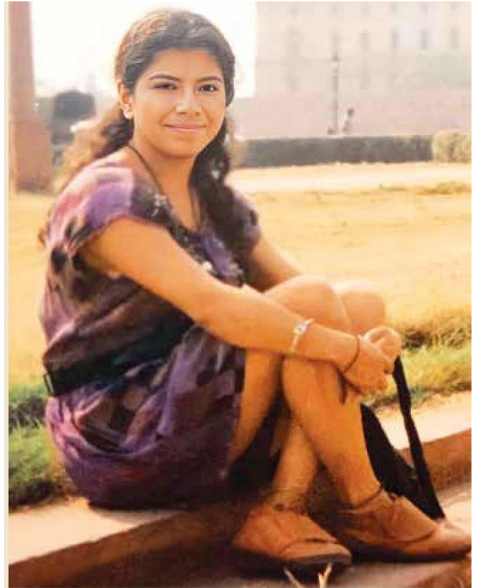
Brugada estudió en la UAM; en esa época decidió mudarse a Iztapalapa.

El 2 de junio pasado, Brugada ganó por más de 12 puntos sobre su más cercano competidor, Santiago Taboada, del PAN-PRI-PRD.