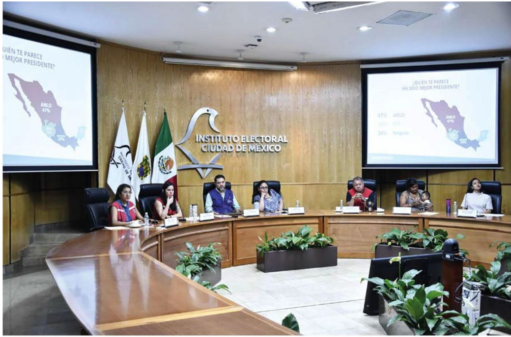
TRABAJO. La organización El Caracol y el instituto electoral capitalino realizaron cuestionarios entre la población callejera.