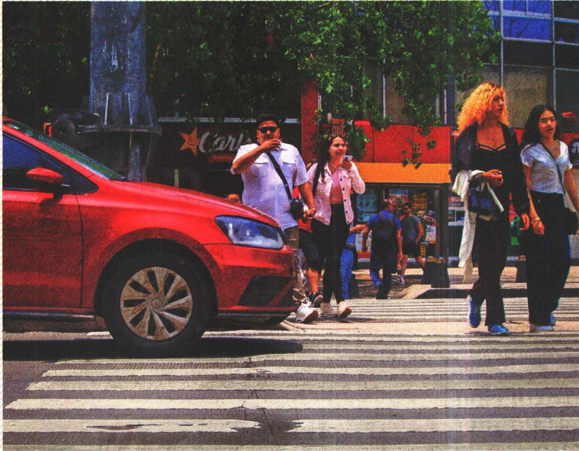
Los principales motivos por los que los agentes de tránsito imponen multas a conductores es por no respetar los cruces peatonales, circular a exceso de velocidad e invadir carriles del transporte público y áreas para bicicletas o motocicletas.