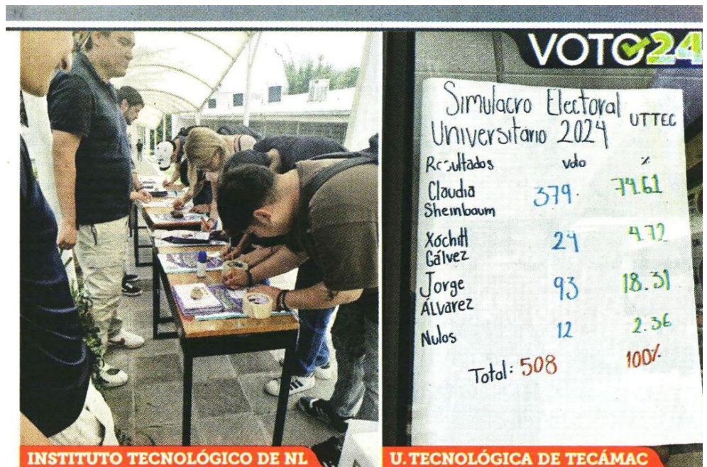
Alumnos de al menos 420 planteles de diversas universidades participaron ayer en el ejercicio que busca promover el voto de los jóvenes el 2 de junio.

Las comunidades universitarias de la BUAP, UAM, UNAM, IPN, UACM y UAE-Mex fueron algunas de las participantes. “Están en su mayoría las autónomas de cada estado, la UANL, la autónoma de Juárez”, abundó.