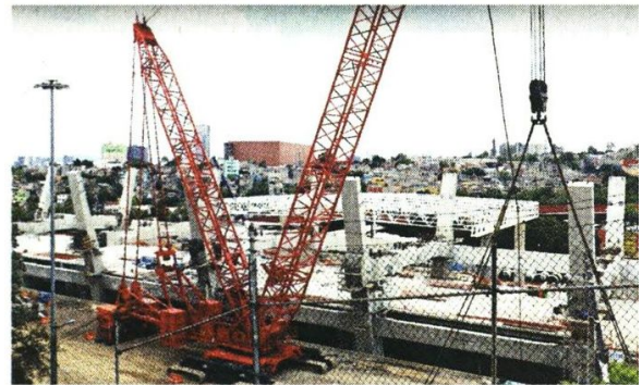
En el lugar, se construye la estación del Tren Interurbano.