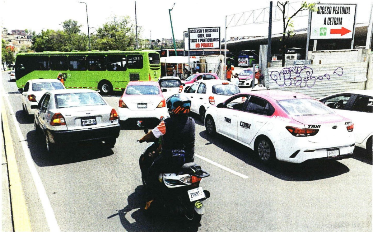
OBSTÁCULOS. Tanto trampas peatonales como reducción en los carriles viales son parte del entorno.