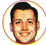
Luis Donaldo Colosio