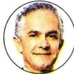
Miguel Ángel Mancera