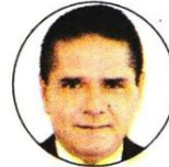
Silvano Aureoles Conejo