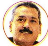
Manlio Fabio Beltrones