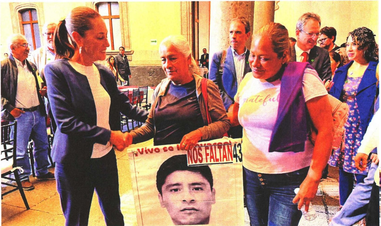
La virtual presidenta electa Claudia Sheinbaum se reunió una hora y 40 minutos con los padres de los 43 en el Museo de la Ciudad de México.