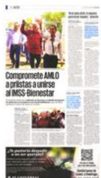
mandatario López Obrador y la virtual presidenta, Claudia Sheinbaum, supervisaron en Lerdo el plan Agua Saludable para La Laguna.