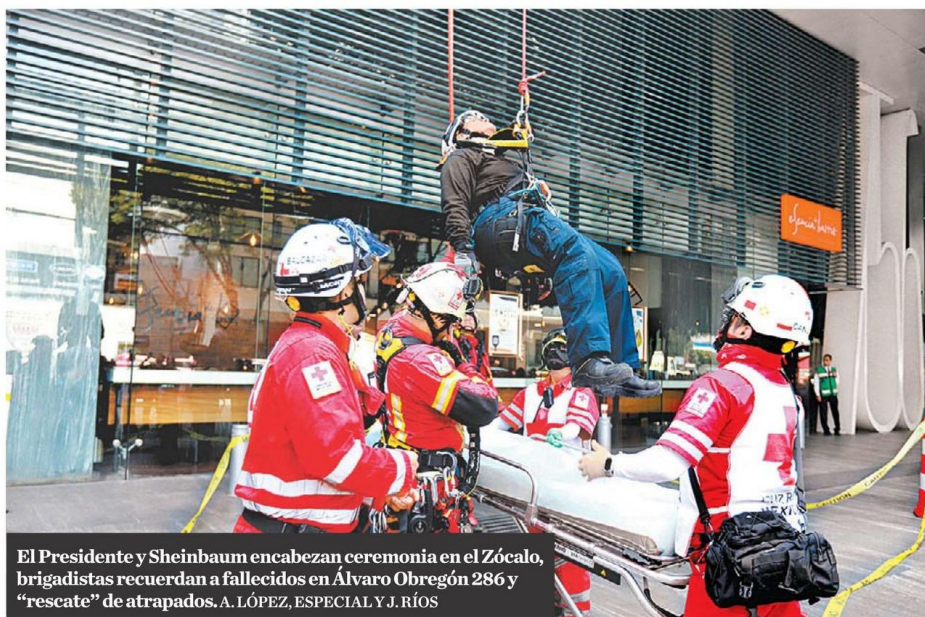
El Presidente y Sheinbaum encabezan ceremonia en el Zócalo, brigadistas recuerdan a fallecidos en Álvaro Obregón 286 y "rescate" de atrapados. A. LÓPEZ, ESPECIAL Y J. RÍOS