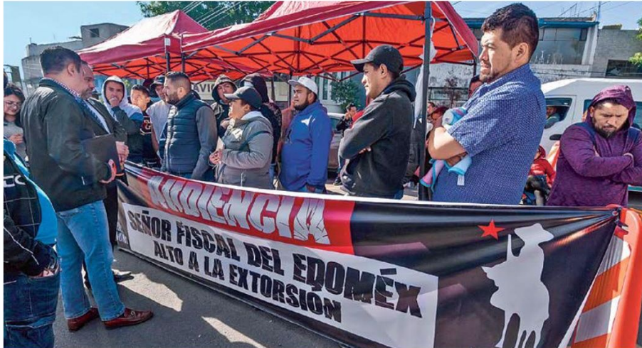
BLANCOS. Los comerciantes están entre los principales afectados por el delito de extorsión.