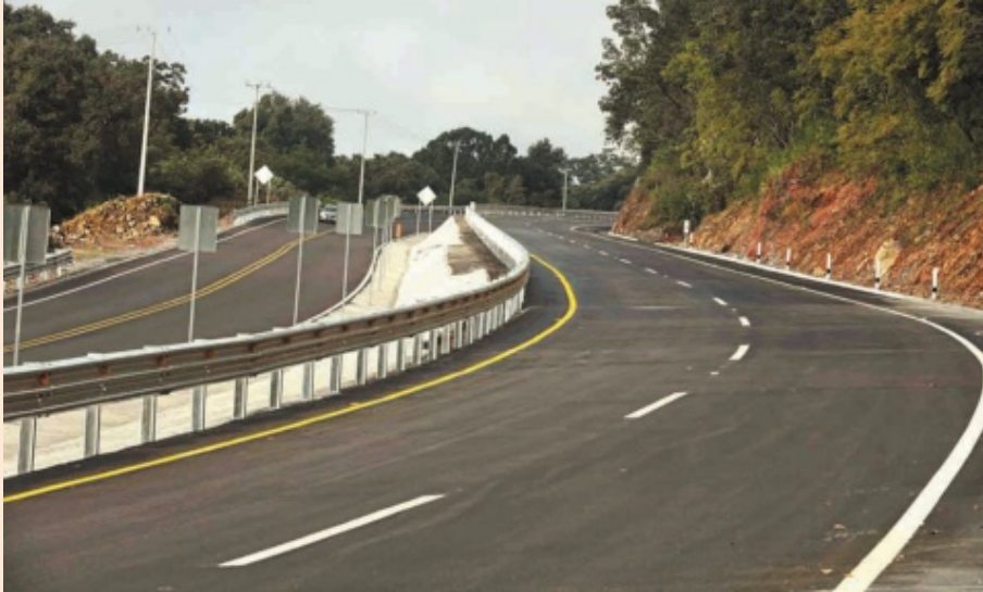
Parte de los listados proyectados contemplaban el desarrollo de carreteras.