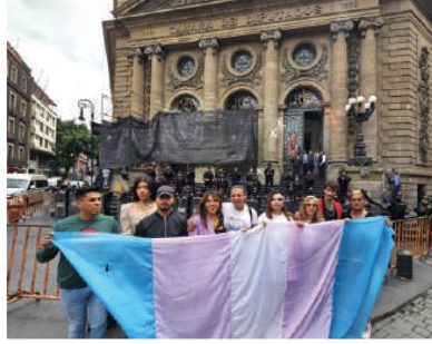
MANIFESTANTES con la bandera trans, ayer, afuera del Congreso de la CDMX.