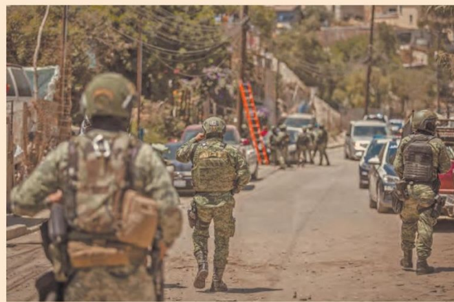
El presidente López Obrador ha señalado que la administración de Sheinbaum será la encargada de consolidar la estrategia de seguridad.