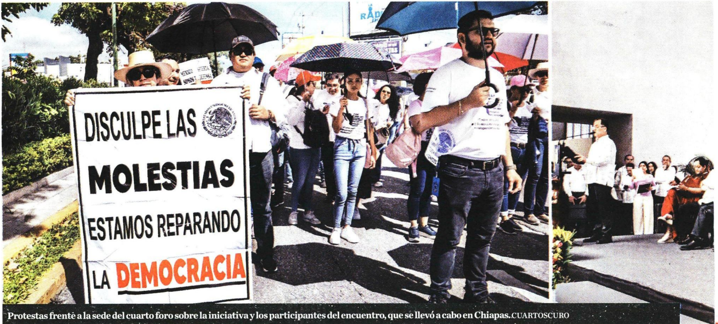
Protestas frente a la sede del cuarto foro sobre la iniciativa y los participantes del encuentro, que se llevó a cabo en Chiapas.