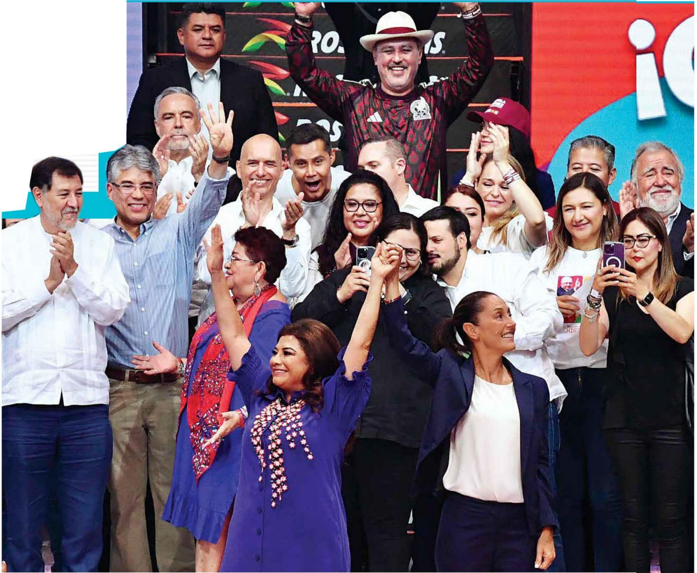
DISTINCIÓN | • Agradecieron y reconocieron a coordinadores y brigadistas por su trabajo en el proceso electoral.