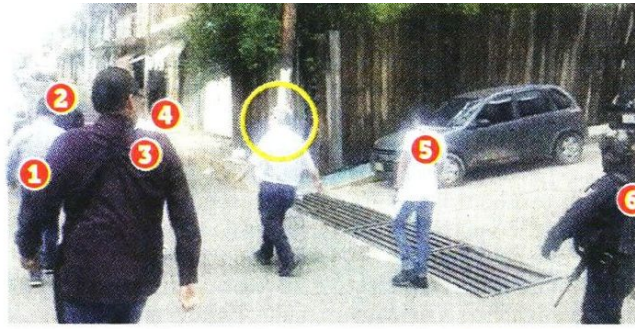
CHILPANCINGO. Luego de 3 asesinatos del nuevo Gobierno municipal, incluyendo al Alcalde Alejandro Arcos, el Edil suplente, Gustavo Alarcón, declaró estar dispuesto a asumir el cargo. "Tengo miedo, pero aquí estamos", dijo tras ir escoltado por elementos estatales y locales.