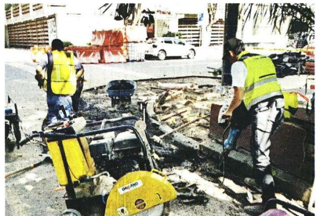
Las nuevas banquetas están siendo implementadas a lo largo de tres cuadras, de Durango a Avenida Chapultepec.

“Pero es un presupuesto pequeño, 2 millones de pesos, entonces sólo alcanza para hacerlo bien en una cuadra, con la intervención de ocho esquinas, en donde habrá cruces peatonales modelo”.