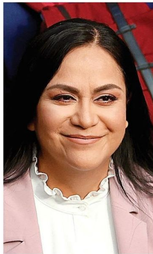
ARIADNA MONTIEL SECRETARIA DE BIENESTAR