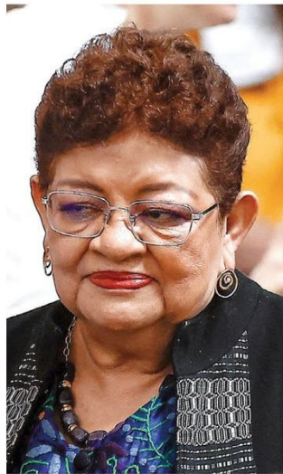
ERNESTINA GODOY CONSEJERA JURÍDICA