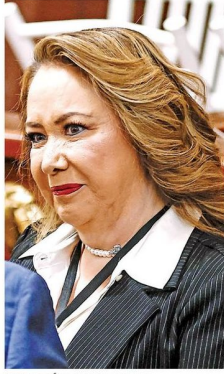
YASMÍN ESQUIVEL MINISTRA DE LA SCJN