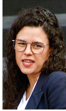
LUISA MARÍA ALCALDE PRESIDENTA DE MORENA