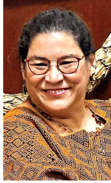
LENIA BATRES MINISTRA DE LA SCJN