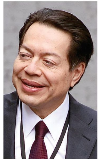
MARIO DELGADO SECRETARIO DE EDUCACIÓN PÚBLICA