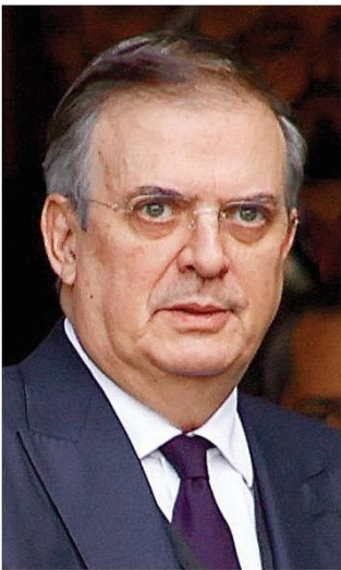
MARCELO EBRARD SECRETARIO DE ECONOMÍA

Tras rendir protesta en el pleno, Clara Brugada salió a las escalinatas del Congreso de la Ciudad de México acompañada por la Presidenta, Claudia Sheinbaum.