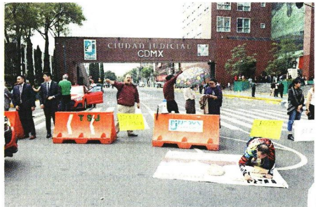
■ Además de no permitir el acceso, en la Ciudad Judicial se organizó un bloqueo sobre Avenida Niños Héroes.