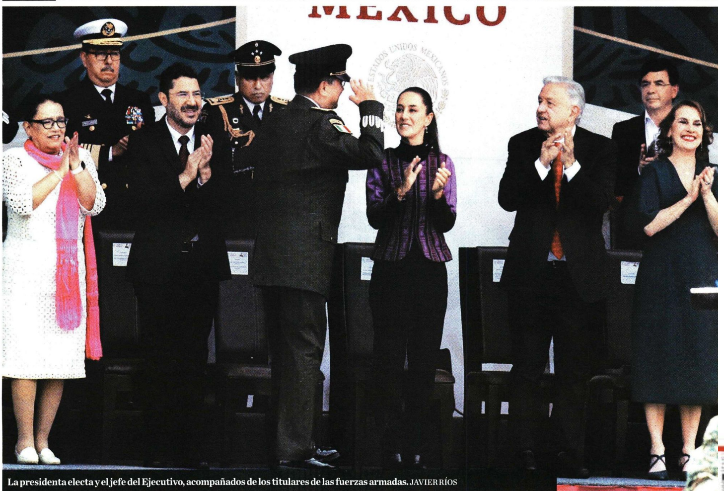
La presidenta electa y el jefe del Ejecutivo, acompañados de los titulares de las fuerzas armadas. JAVIER RÍOS