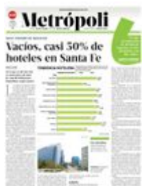
Gráfico: Daniel Rey