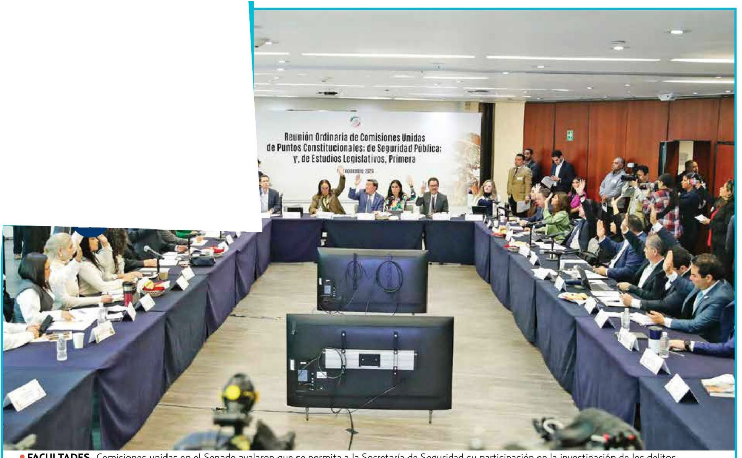
• FACULTADES. Comisiones unidas en el Senado avalaron que se permita a la Secretaría de Seguridad su participación en la investigación de los delitos