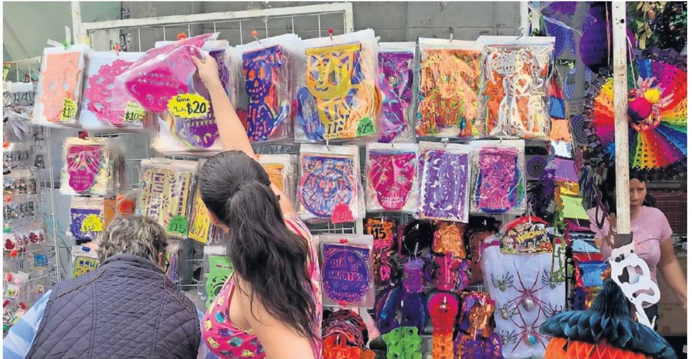
En el Centro se encuentra una gran variedad de productos para Día de Muertos como catrinas, calaveras y papel picado, pero hechos en China.