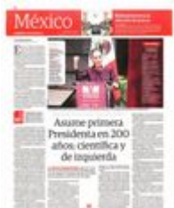
LA ENTONCES Presidenta electa, Claudia Sheinbaum, el pasado 25 de septiembre, en la inauguración del Museo Vivo del Muralismo.

17:55 HRS. Ceremonia en el Zócalo con pueblos indígenas y entrega del bastón de mando. Mensaje y regreso a Palacio Nacional.