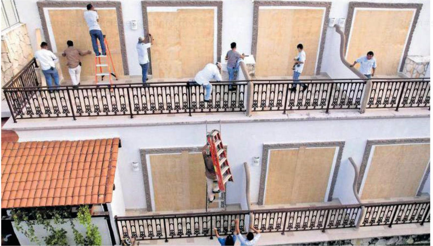
Trabajadores colocan tablas de madera para cubrir puertas de vidrio en un hotel horas antes del arribo del huracán, en Playa del Carmen