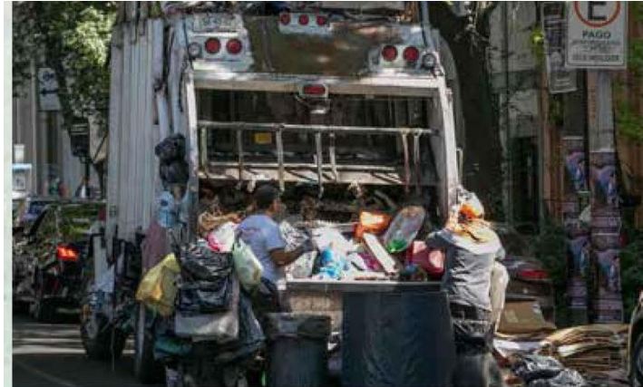
Solo el 28 por ciento de los residuos que se generan a diario en la CDMX son reusados y reciclados