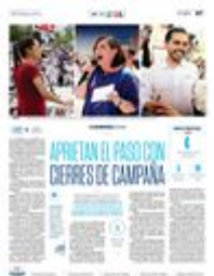
APOYOS | • Sheinbaum viajó a Veracruz, Puebla y Morelos. Gálvez también estuvo con poblanos. Máynez visitó Manzanillo, Colima.