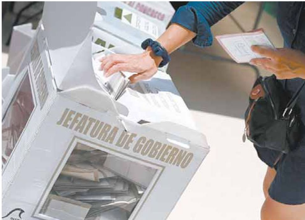
➕ Hubo una buena participación de los habitantes para elegir la Jefatura de Gobierno.