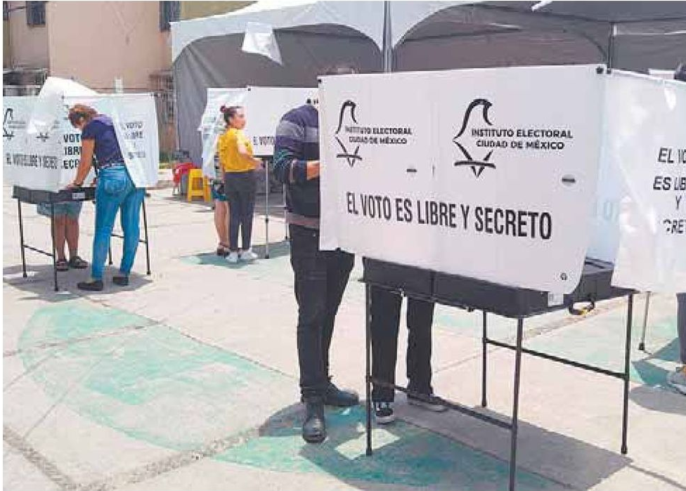
➕ Miles de capitalinos acudieron a sufragar en las casillas de la entidad.