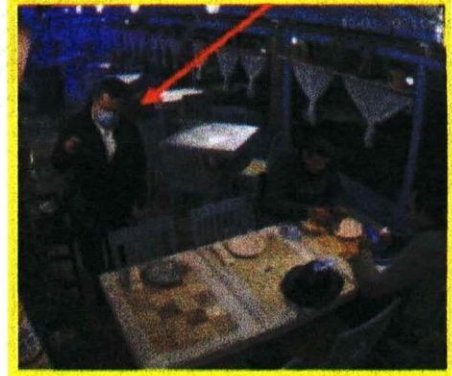
FISCALÍA DE COLOMBIA A TRAVÉS DE @INDAGATORIAS