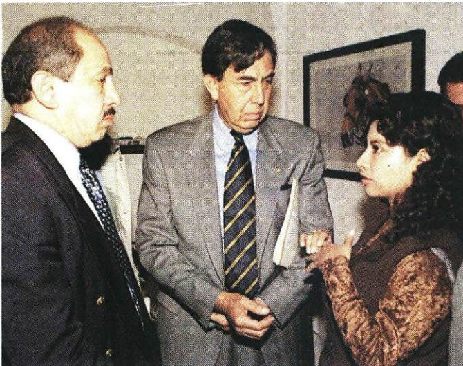
1997. La entonces diputada federal conversa con el entonces Jefe de Gobierno electo, Cuauhtémoc Cárdenas.