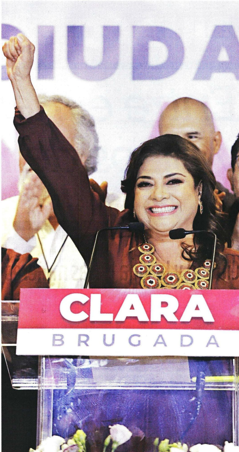
LA NUEVA TITULAR. Clara Brugada se convertirá en la segunda Jefa de Gobierno que tiene la Ciudad de México.