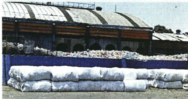
■ Las pacas son colocadas dentro de costales para evitar que los residuos se separen en el traslado.