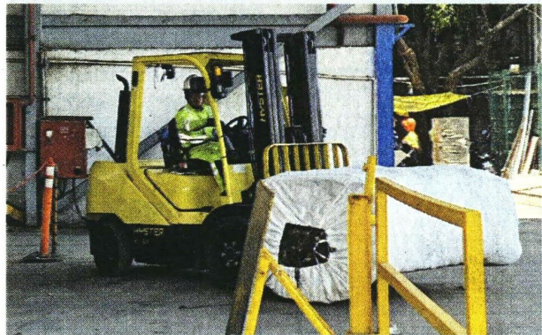
■ Las lonas y pendones son comprimidos en pacas, para su uso como Combustible Derivado de Residuos, en los hornos.