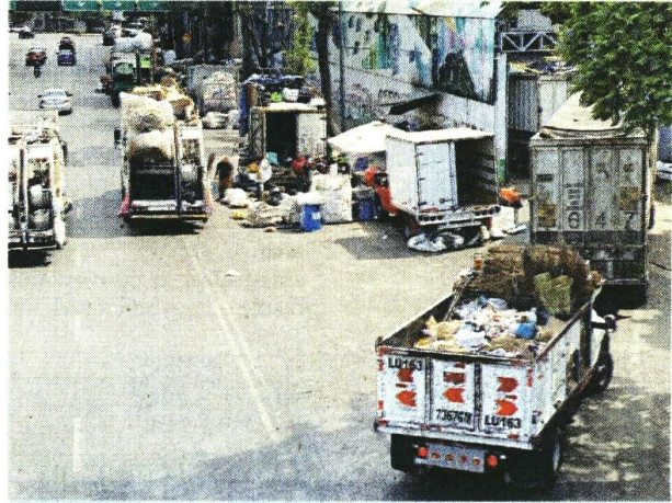
■ Tras la jornada electoral, los pendones comenzaron a ser retirados, y actualmente se les procesa en la planta de selección de la Alcaldía Gustavo A. Madero.