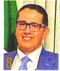
LUIS MENDOZA Alcalde electo en: Benito Juárez. Cargo anterior: Diputado federal.