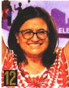
ALEIDA ALAVEZ Alcaldesa electa en: Iztapalapa. Cargo anterior: Diputada federal.