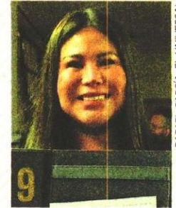
LOURDES PAZ Alcaldesa electa en: Iztacalco. Cargo anterior: Diputada local.