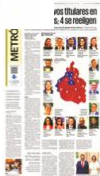
7 JAVIER LÓPEZ Alcalde electo en: Álvaro Obregón. Cargo anterior: Diputado federal.