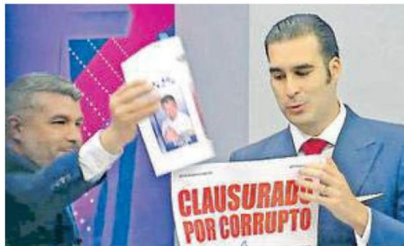
CAPTURAS DE PANTALLA