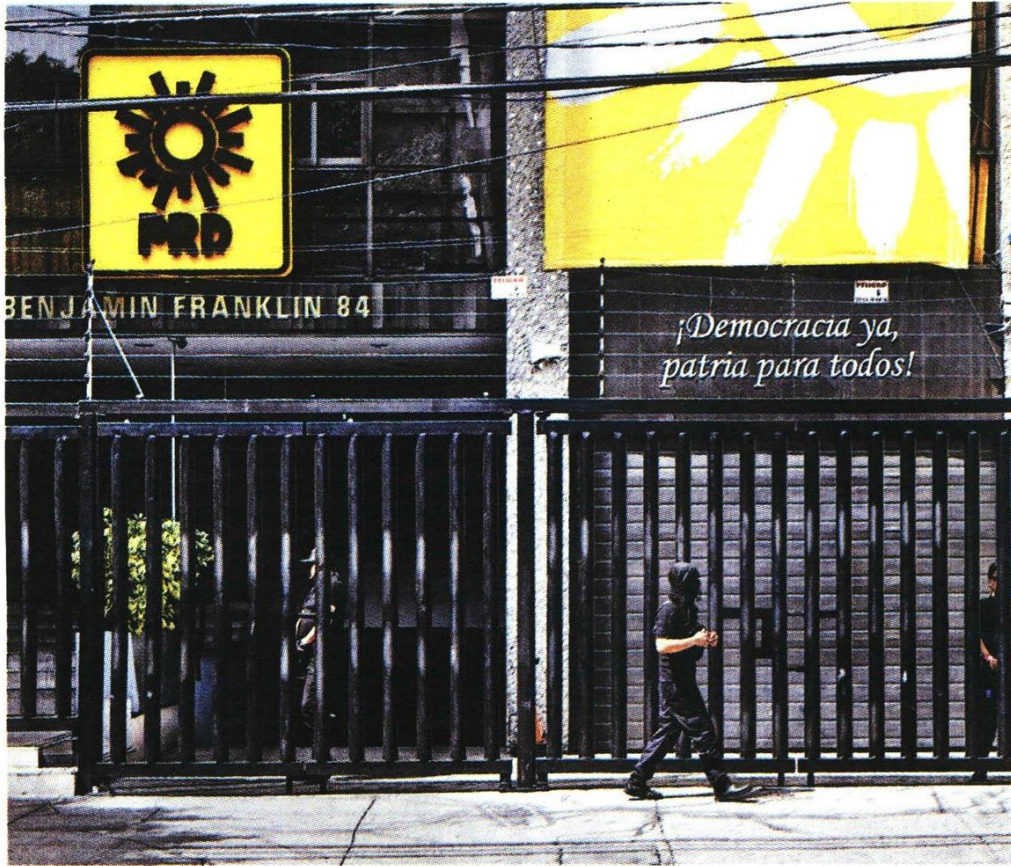
Instalaciones del organismo en la capital del país.