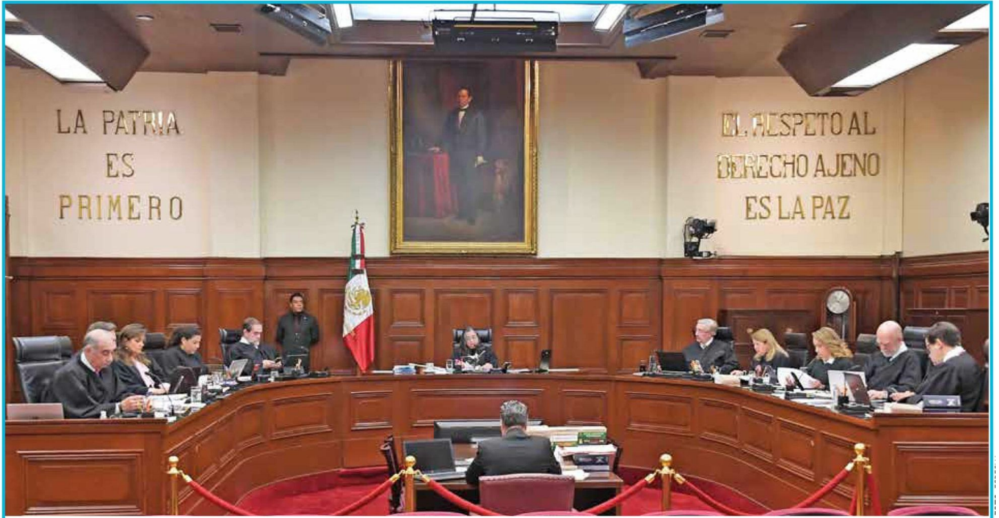
DEBATE. Los ministros de la Corte se desistieron de discutir de fondo la Reforma Judicial, por lo que la norma aprobada y publicada queda vigente.