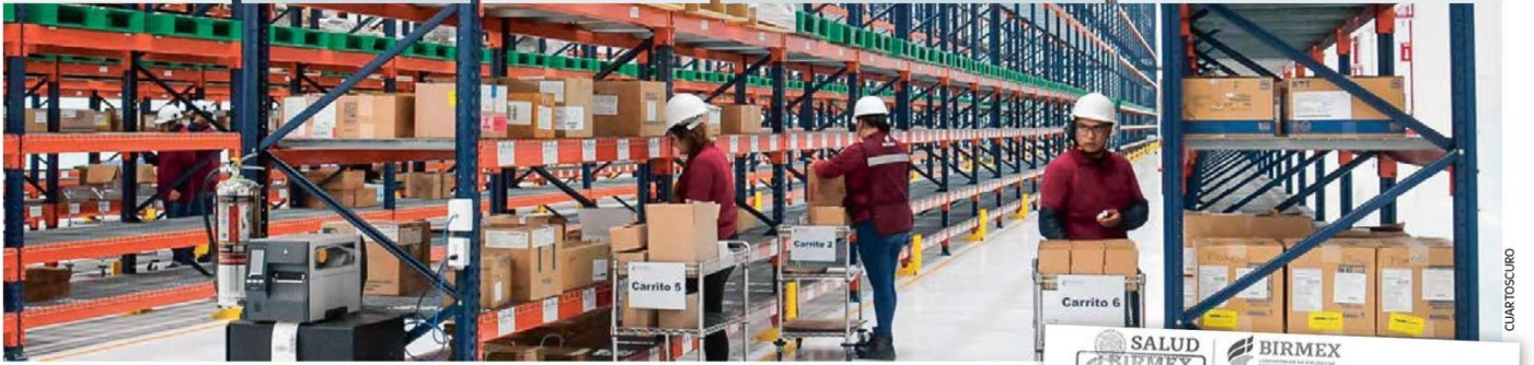
ORGANISMO. La Megafarmacia del Bienestar es controlada por Birmex.