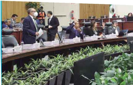
LEY ELECTORAL | • La Dirección Ejecutiva de Prerrogativas y Partidos Políticos del INE es el órgano encargado de realizar las ministraciones a los partidos políticos.