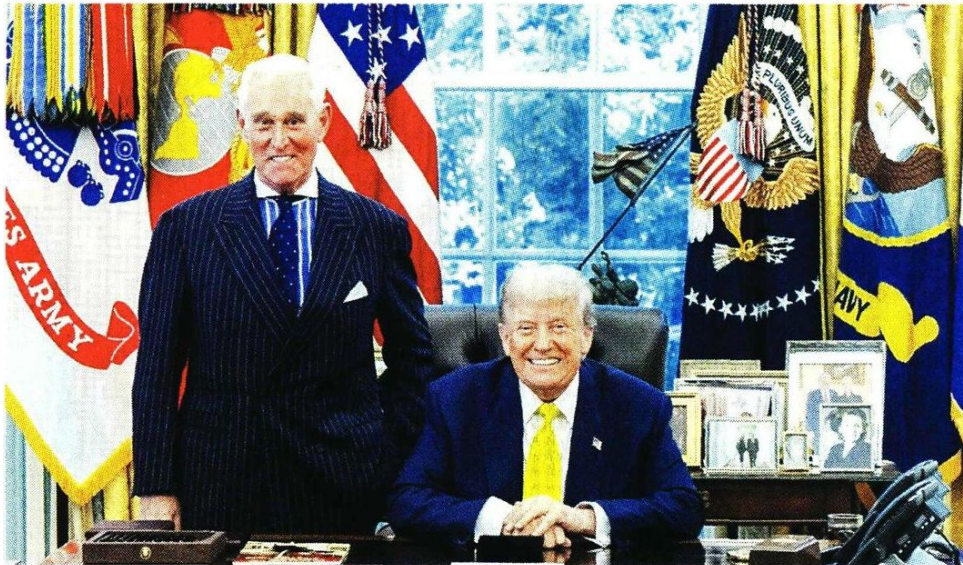
MANCUERNA. El polémico asesor político Roger Stone fue uno de los principales gestores de la carrera presidencial de Donald Trump.