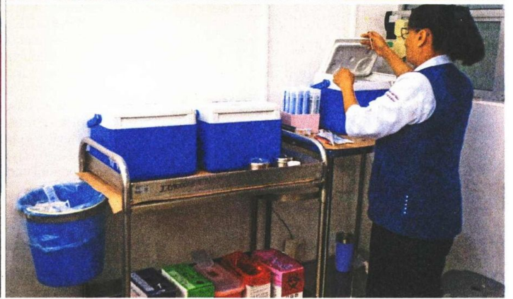
Expertos recomiendan vacunarse contra Covid-19, ya que todos los biológicos funcionan para evitar daños mayores.