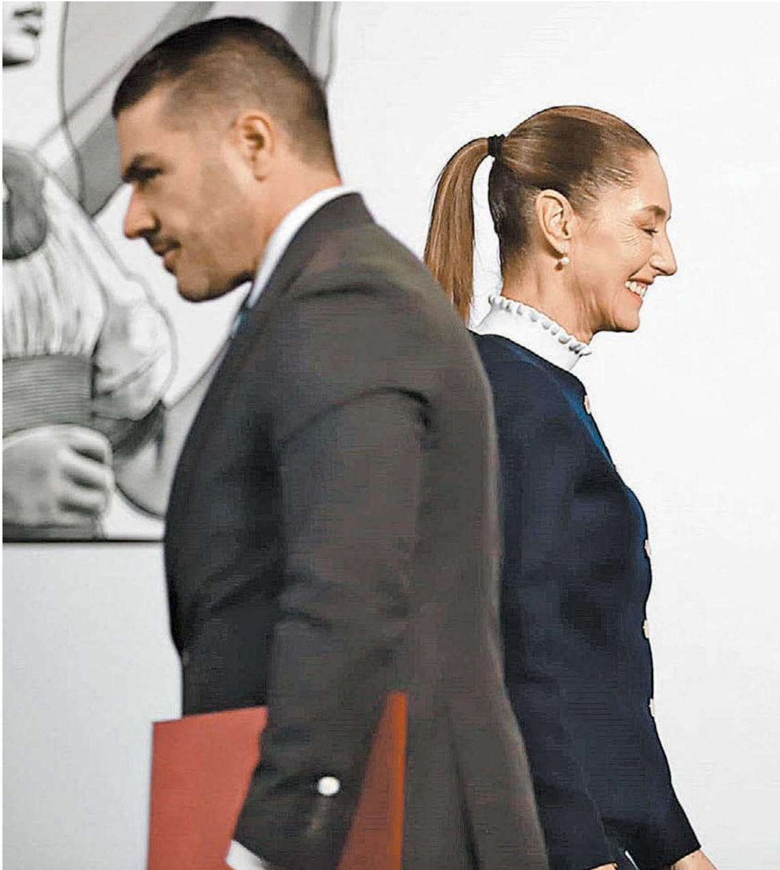
Omar García Harfuch, titular de Seguridad, y la mandataria en la conferencia matutina. JAVIER RÍOS

— Omar García Harfuch llegó anoche al estado y reportó un decomiso de 1,100 kilos, con valor en el mercado de 400 mdd. PÁGS. 14 Y 15