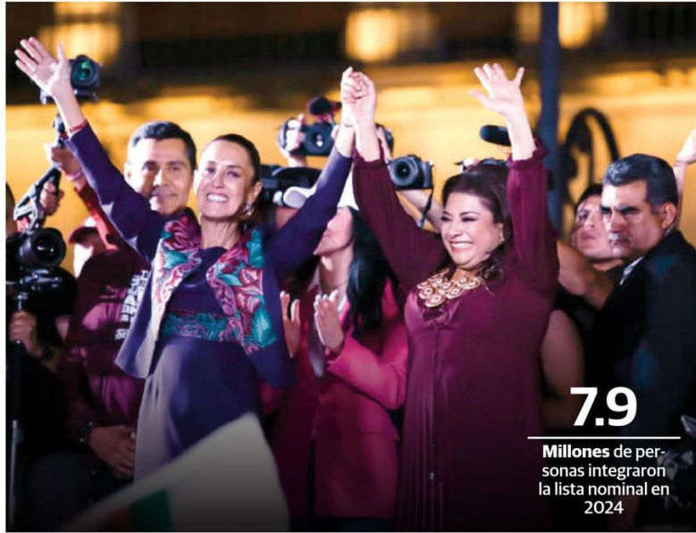
CLAUDIA Sheinbaum y Clara Brugada, el 2 de junio, en el Zócalo tras las elecciones.