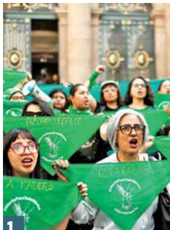
1 Exigen freno a corridas de toros

Colectivas se manifestaron frente al Congreso de la Ciudad de México para exigir que no se aplaze la discusión del dictamen que despenaliza el aborto. Afirmaron que así se “asegura que nadie más sea criminalizado por decidir sobre su cuerpo”.