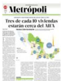
Gráfico: Rodolfo Gómez García