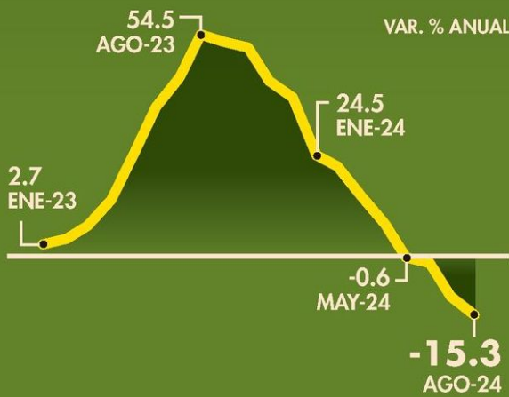
México | Valor de la producción de sector de la construcción