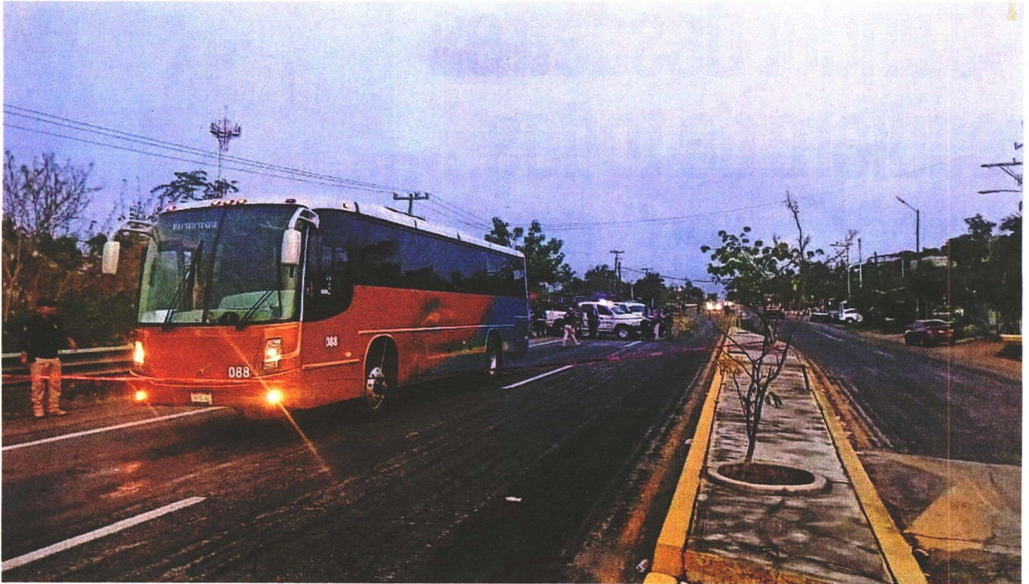
Salvador Villalva Flores viajaba en un autobús y a las tres de la mañana un grupo armado detuvo el vehículo, subió una persona y acribilló al edil electo.