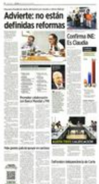
LIMPIEZA. Al llegar a su oficina de transición, la Presidenta electa saludó a trabajadores de limpia.