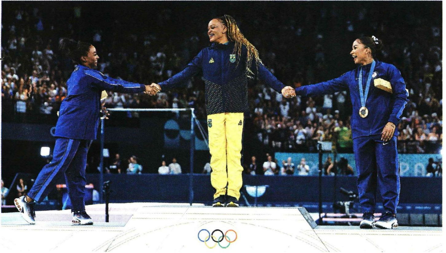
Andrade es felicitada por Simone Biles y Jordan Chiles.