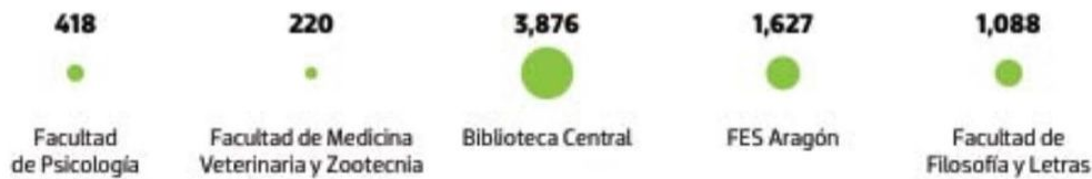
Gráfico: Rodolfo Gómez García