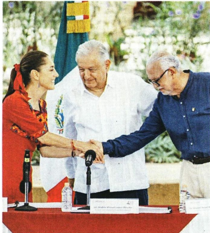
■ En la presentación del plan de justicia de Nayarit estuvo la virtual Presidenta electa, Claudia Sheinbaum (izq.); AMLO, y el Gobernador del estado, Miguel Ángel Navarro.