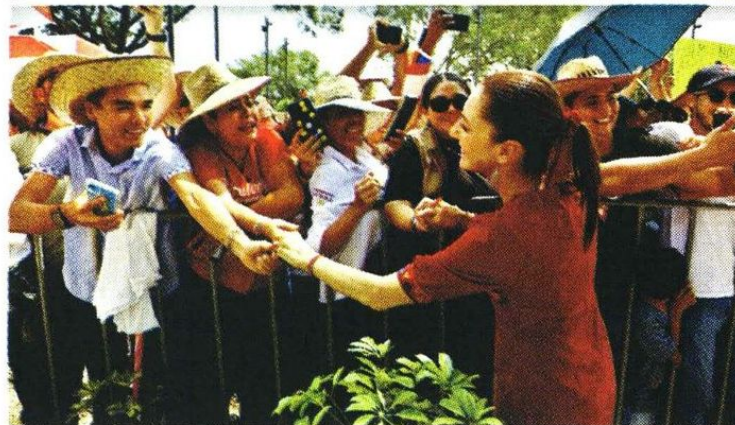
■ El Presidente López Obrador aprovechó para firmar una fotografía y Sheinbaum para saludar a simpantizantes.