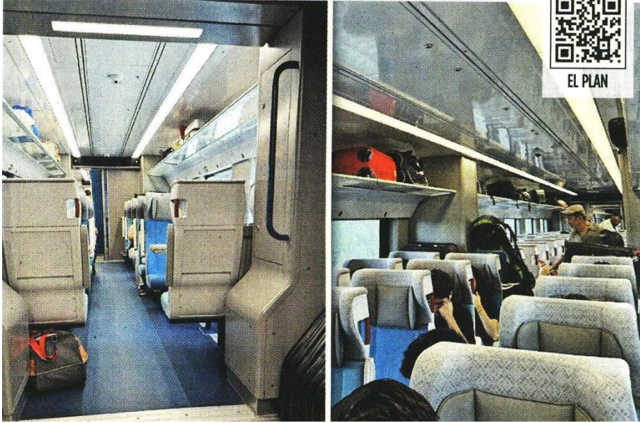
■ El Tren Maya, considerado como una de las obras emblemáticas del Gobierno de AMLO, opera con baja ocupación de pasajeros.